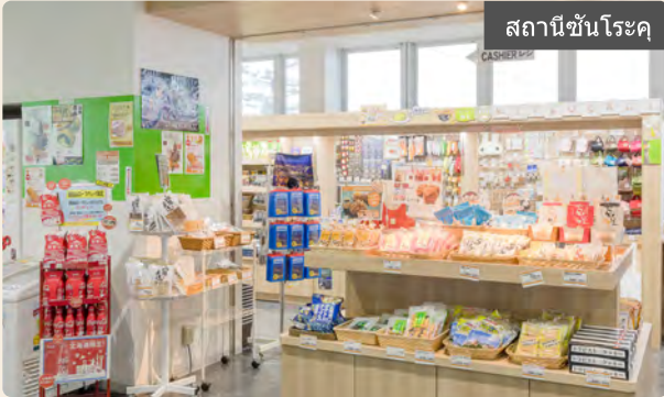
สถานีชั้นโรด