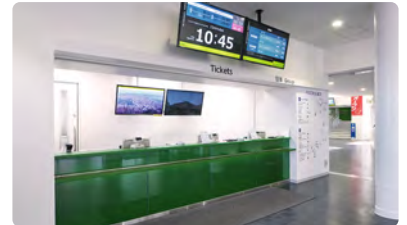
산로쿠 1F 티켓 카운터