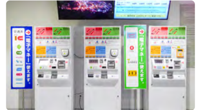
산로쿠 1F 티켓 판매기

■대응 전자 화폐: 교통카드 계열의 전자 화폐, 라쿠텐 Edy, WAON, nanaco, iD ※산정상 티켓 판매기에서는 라쿠텐 Edy, WAON, nanaco, iD를 사용할 수 없습니다. ※본 시설에서는 전자 화폐를 충전할 수 없습니다.